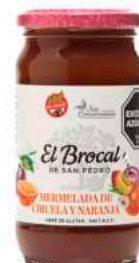
CIRUELA Y NARANJA