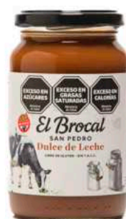
DULCE DE LECHE